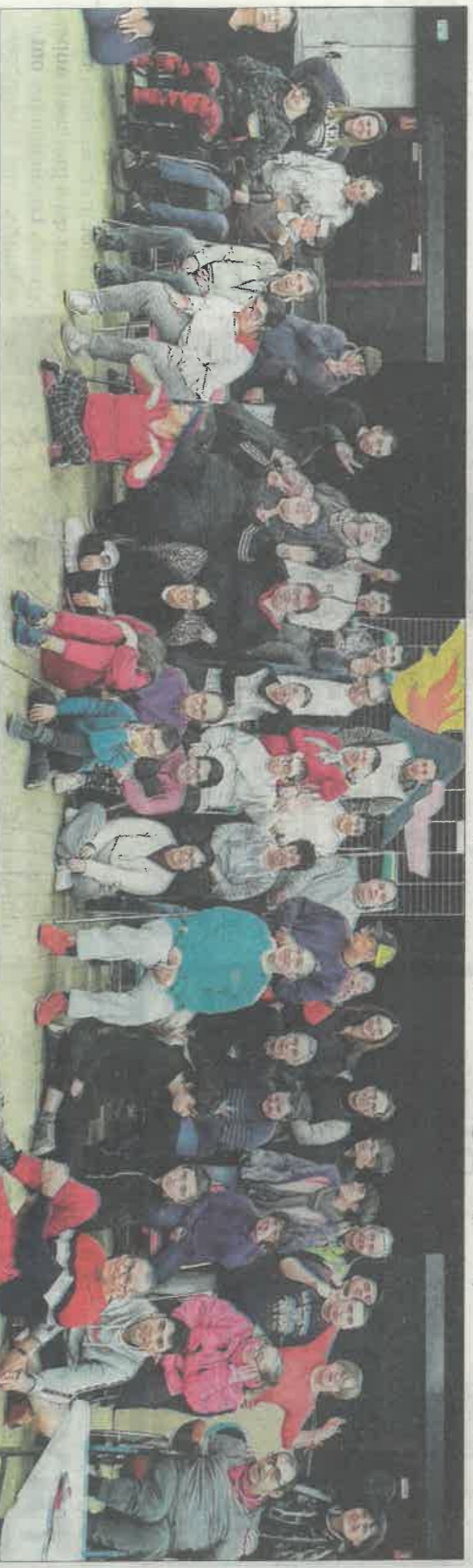
Une soixantaine de personnes ont été réunies jeudi 8 février à la salle polyvalente des Chaudannes autour du thème des "mini-jeux paralympiques".

À l'initiative des bénéficiaires du "PATO" de l'association Deltha Savoie (petit groupe de personnes du foyer d'hébergement "Les Arves" qui sont accompagnées en journée), une soixantaine de personnes ont été réunies jeudi 8 février à la salle polyvalente des Chaudannes autour du thème des "mini-jeux paralympiques". La salle était prêtée gracieusement par la municipalité de Saint-Jean à Deltha Savoie, association familiale qui accompagne des personnes en situation de handicap.